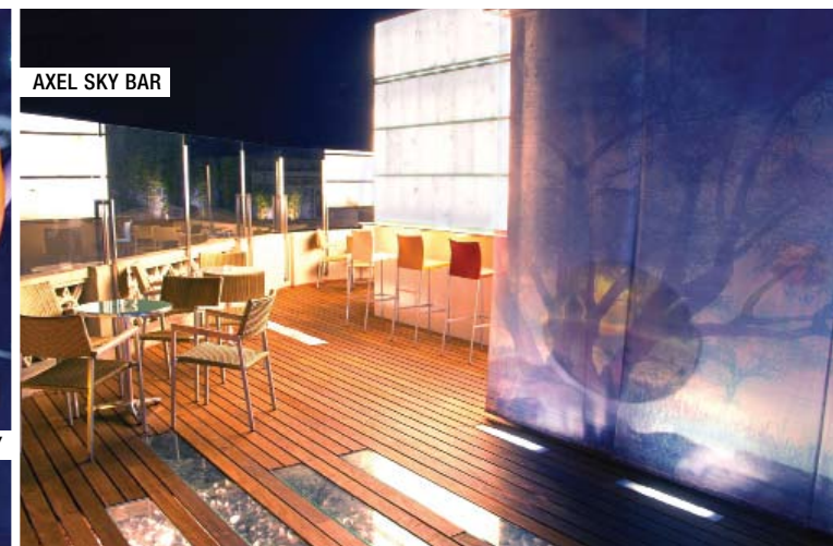
AXEL SKY BAR