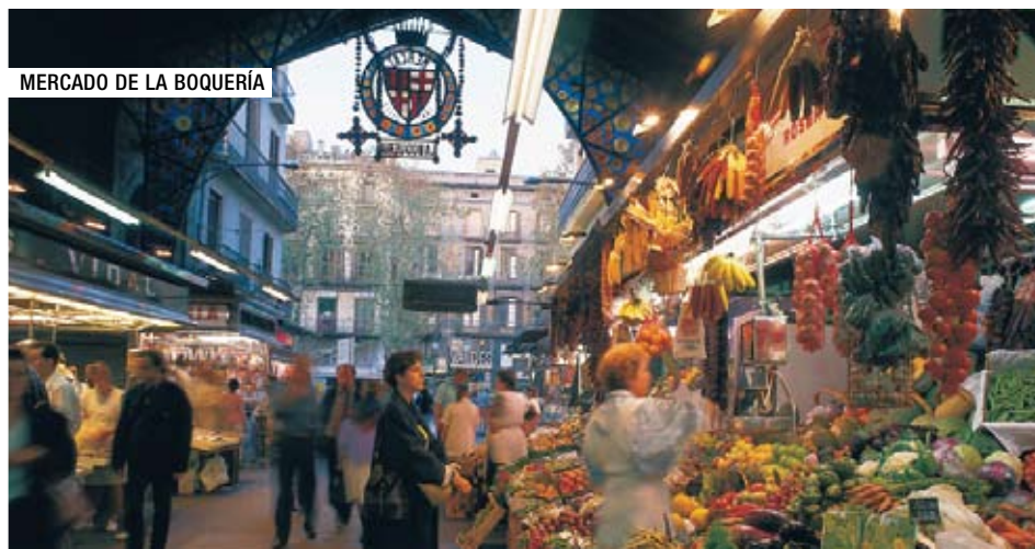
MERCADO DE LA BOQUERÍA