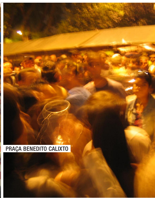
PRAÇA BENEDITO CALIXTO