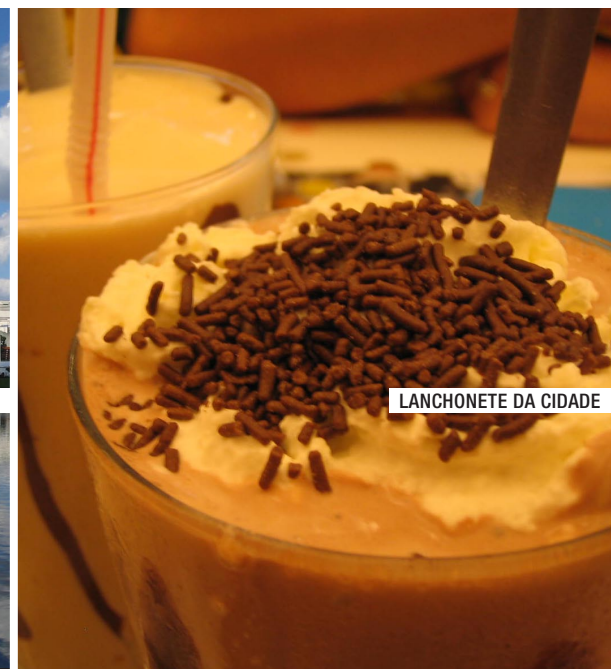
LANCHONETE DA CIDADE