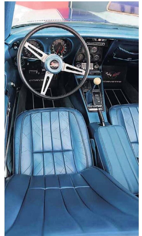
Celeste. O revestimento azul é original e foi mais valorizado pela nova pintura branca

tive. Além disso, quatro amigos meus, que admiravam meu primeiro Stingray, hoje também são donos de Corvette.”