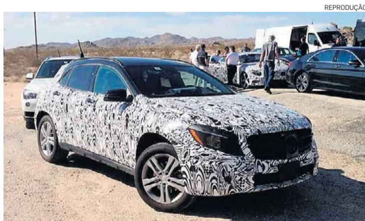
GLA. Executivo da Mercedes mostrou foto do crossover

A menos de um mês da abertura do evento, as montadoras já começaram a divulgar o que terão em destaque no Messe. Principalmente as donas da casa. A Mercedes-Benz ainda não mostrou fotos da versão definitiva do crossover GLA, confirmado como uma de suas estrelas na mostra. Porém, na semana passada um executivo da montadora postou em sua conta no Twitter imagens do carro com camuflagem pesada. A marca também apresentará o S 63 AMG, o Classe S apimentado.