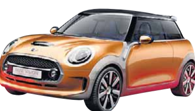
Vision. Protótipo traz as linhas do novo Mini Cooper

A BMW terá a versão final do cupê Série 4, enquanto a Audi revelará a opção conversível da nova geração do A3.