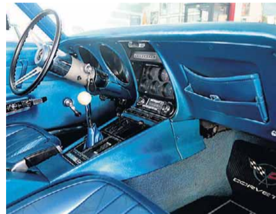
Cabine. Volante, painel e console entregam a esportividade nostálgica do conversível