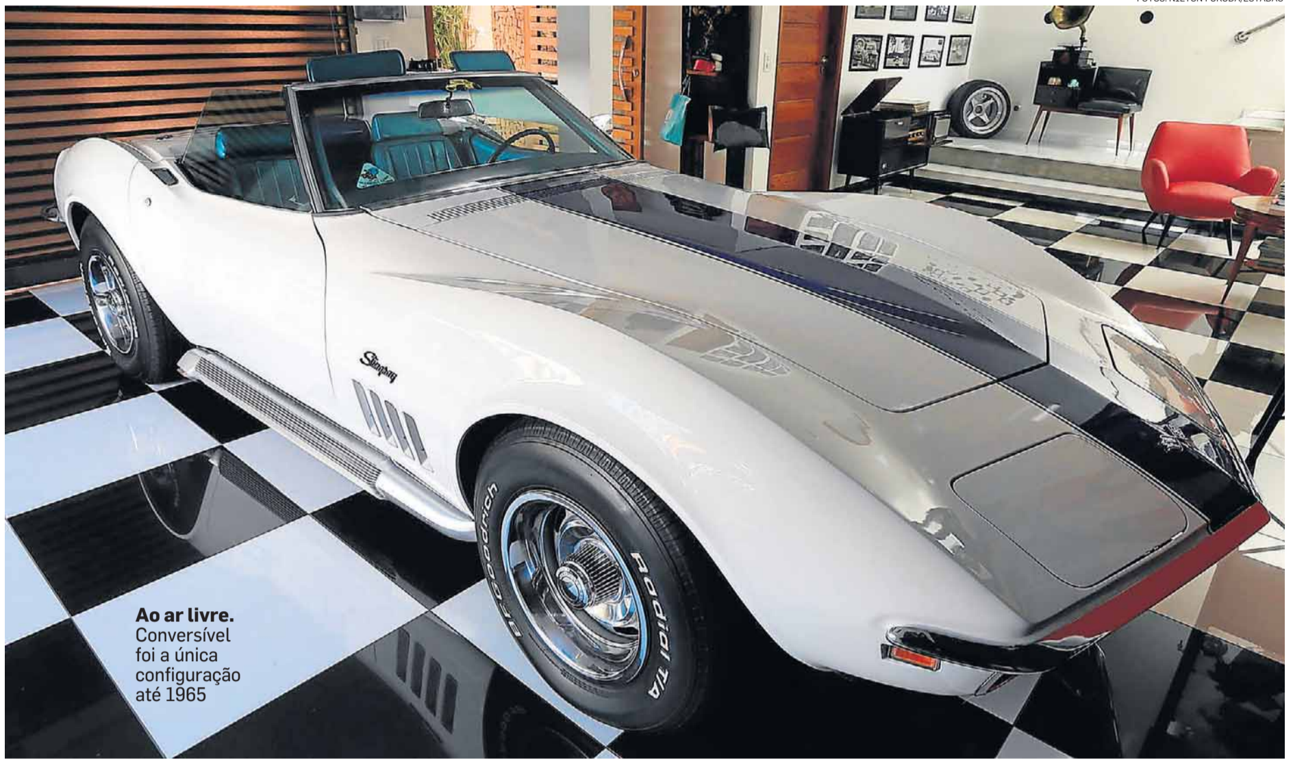
Ao ar livre. Conversível foi a única configuração até 1965

Já de pessoas mais próximas, as reações são sempre carinhosas. “Aqui em casa, todo mundo é ‘corvetteiro’ e fã da Chevrolet. Tenho inclusive um Opala 1975 idêntico ao primeiro carro que