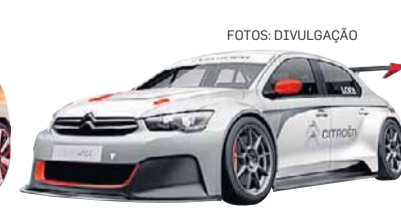
Rali. Citroën C-Élysée tem versão de competição

Entre as estrangeiras, a inglesa Mini – controlada pela BMW – anunciou que o protótipo Mini Vision será sua atração. O modelo antecipa as linhas da próxi-