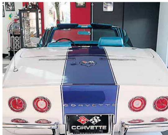
Detalhes. As lanternas traseiras circulares tornaram-se marca registrada dos Corvette. O motor V8 de 5 litros traz novas válvulas e está tinindo

O nome Stingray, usado entre 1963 e 1976, foi retomado na recém-apresentada sétima geração do modelo.