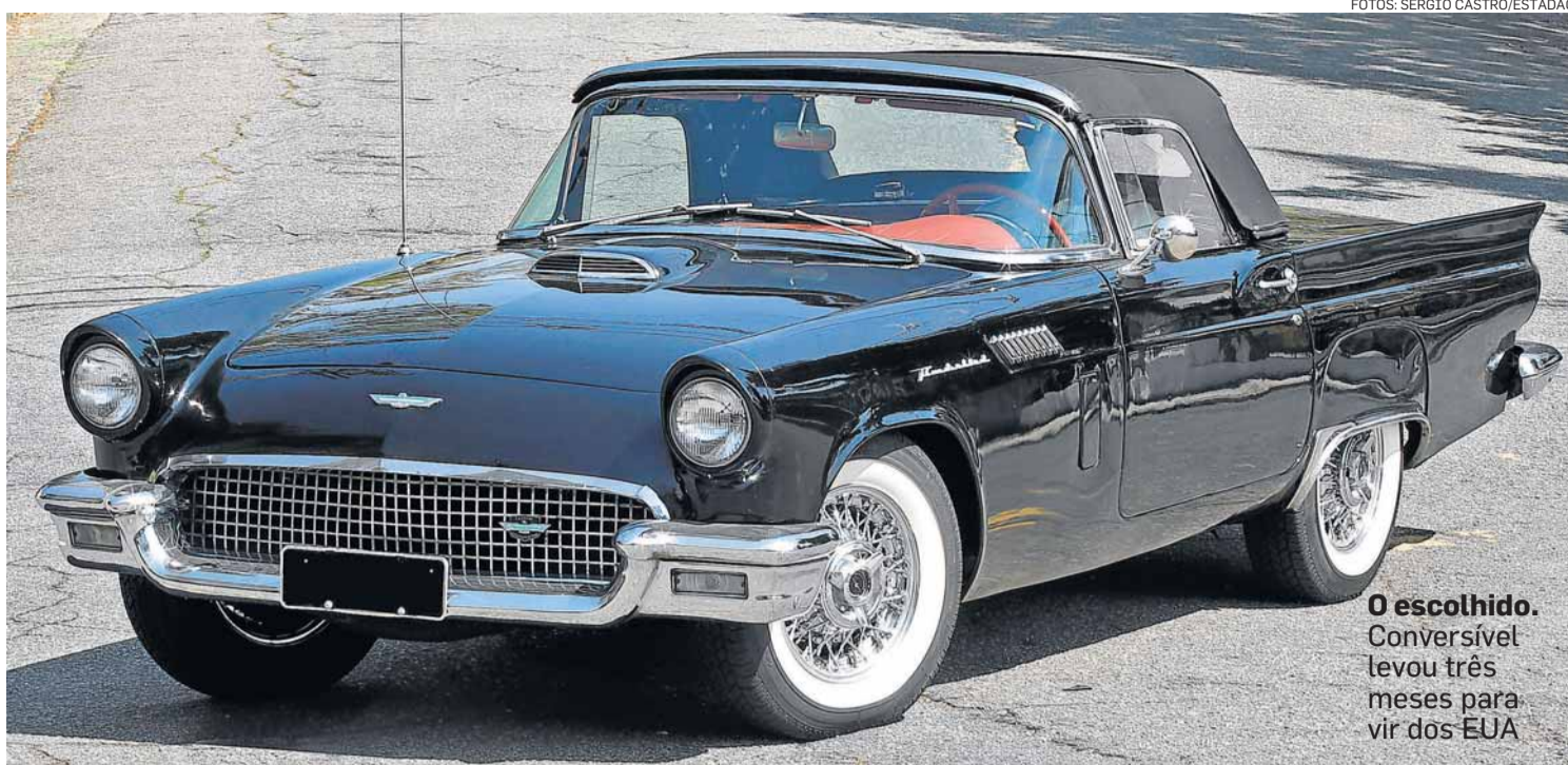
O escolhido. Conversível levou três meses para vir dos EUA

Nas ruas, aliás, o tom é sempre de reverência. “O respeito que as pessoas têm pelo carro antigo é impressionante. O velhinho atrai gentileza, os outros fazem questão de dar passagem. Já quando estou com meu veículo de uso, é aquela guerra”, brinca o juiz.