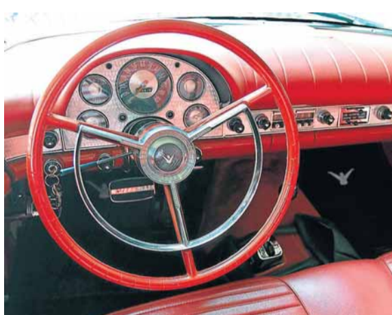
Autenticidade. Originalidade foi preservada nos mínimos detalhes. Até o rádio é da época