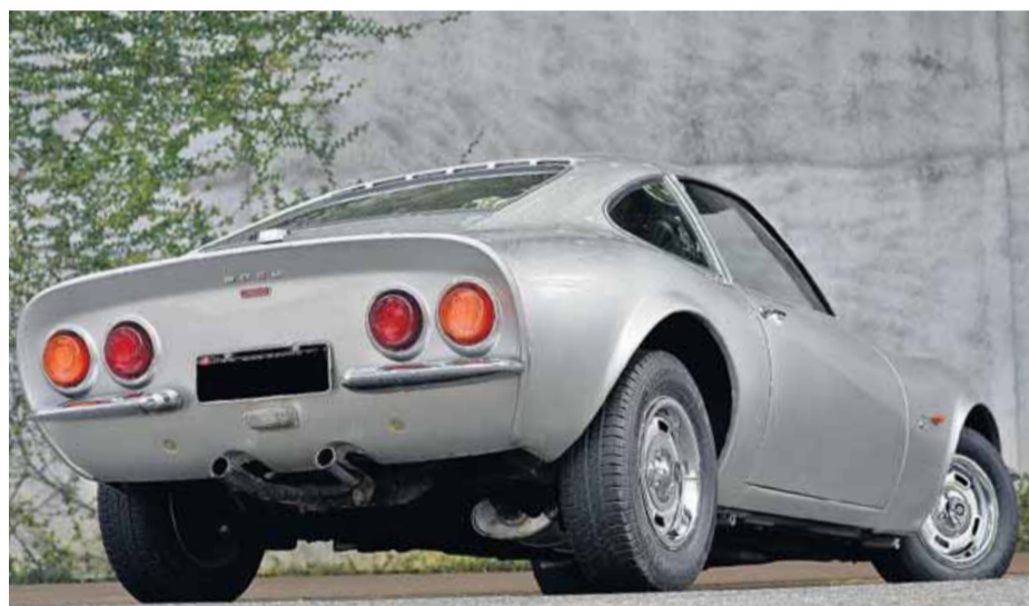
Inusitado. Não há tampa traseira. Espaço para malas fica atrás dos bancos