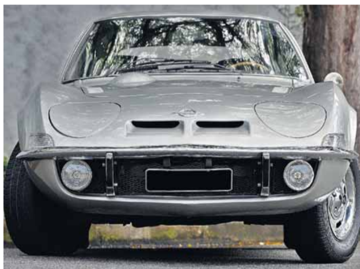
Olhos fechados. Faróis escamoteáveis giram ao ‘abrir’