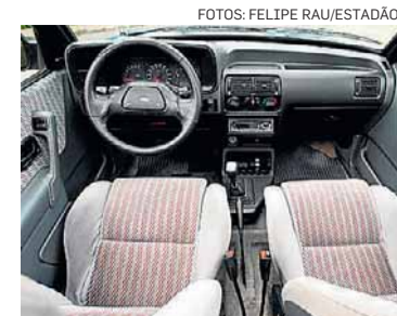
Cabine. Versão esportiva traz detalhes vermelhos