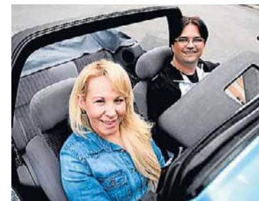
Casal. A esposa de Cruz apoia sua paixão pelo XR3