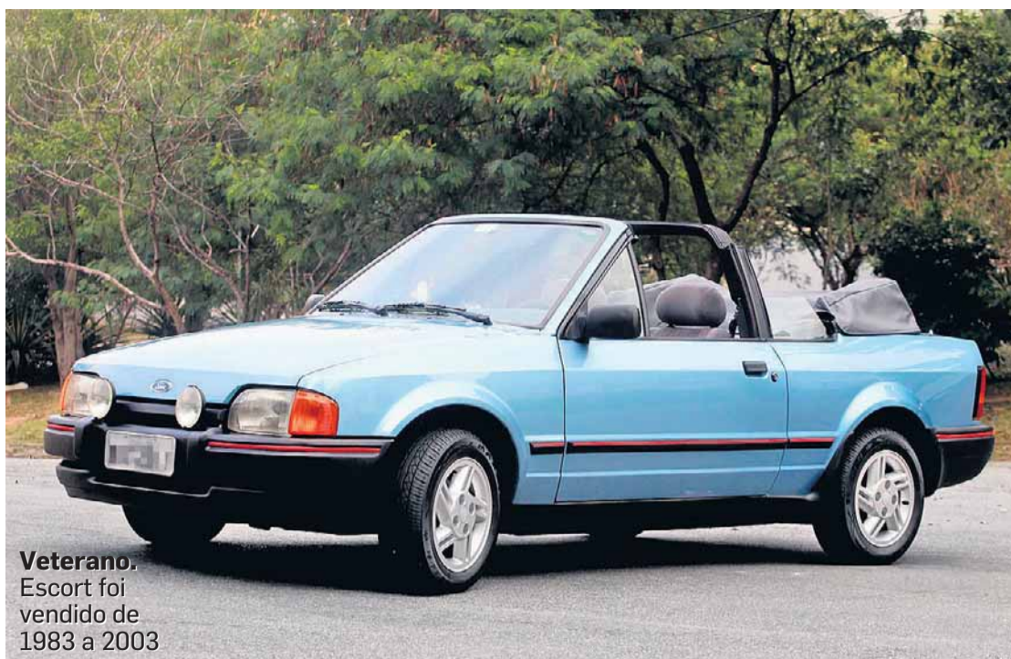
Veterano. Escort foi vendido de 1983 a 2003

A esposa Patrícia também gosta do Escort e viaja com ele à procura de mais exemplares. “Fomos a Santa Catarina para ver outro conversível, mas ele não estava em bom estado. Agora quero um XR3 com capota fixa, que seja anterior à reestilização de 1987.”