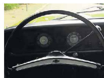
Espaçoso. Haste do câmbio de três marchas fica no volante