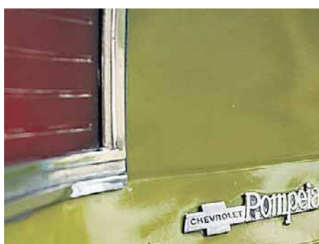
Origem. Carro veio de antiga loja GM