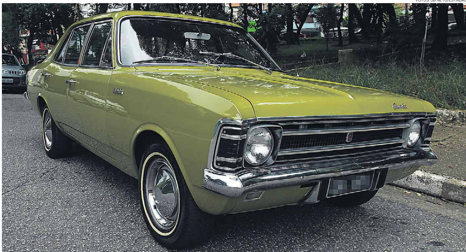
Básico. Pintura original verde-abacate valoriza as linhas do modelo, que é da versão Standard com motor quatro-cilindros

Com banco dianteiro inteiriço e câmbio de três marchas com alavanca no volante, o sedã exi-