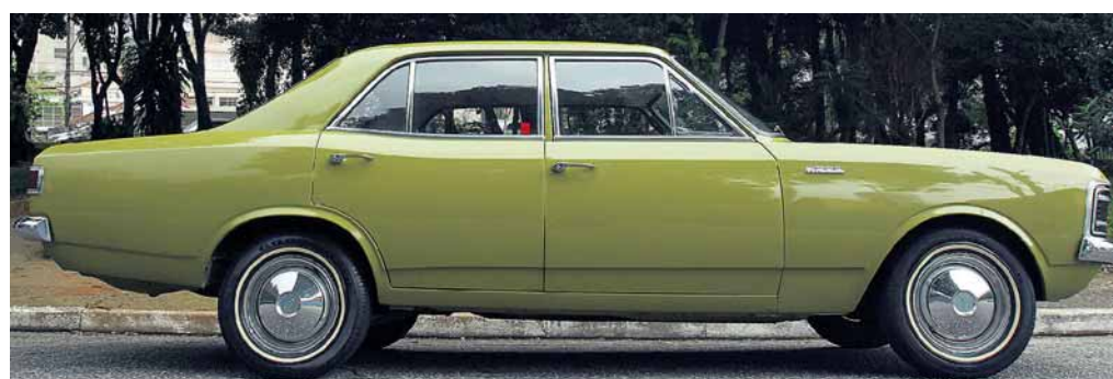
Perfil. Na versão de topo, Chevrolet se consagrou como o sedã mais luxuoso do País

giu que seu novo dono se adaptasse a ele. “O problema é fazer curvas. Tem de se segurar, senão o volante fica e você sai andando, porque escorrega no banco.”