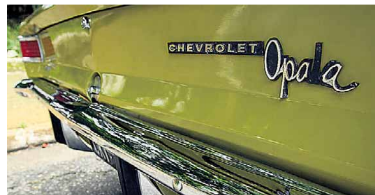
Geração. Traseira manteve as mesmas lanternas até 1975