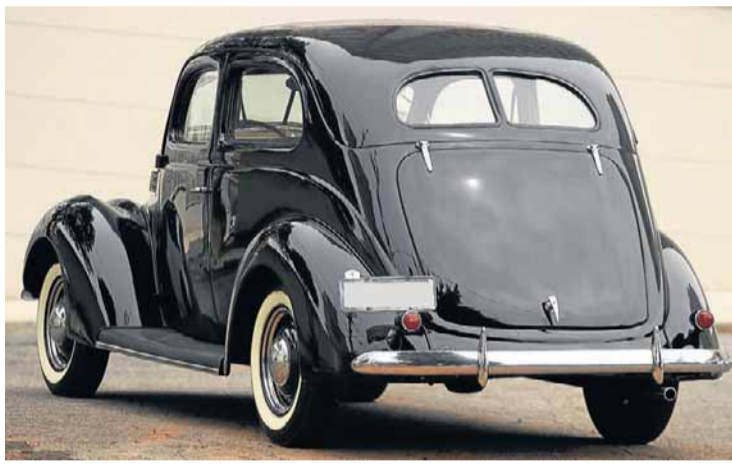
Gama. Havia versões cupê, sedã, perua, conversível e picape

Como outros donos de antigos, Fabiano só roda com sua relíquia nos fins de semana. Até porque não se trata de um modelo com vocação para o dia a dia.