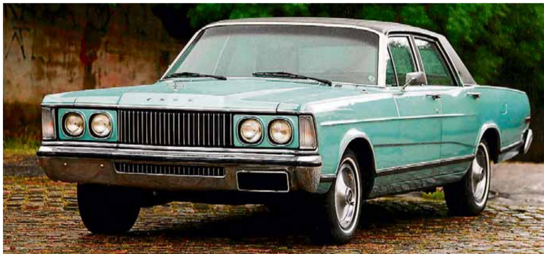
Conservado. Leitor conta que o Ford nunca foi restaurado. ‘Até os pneus são originais’, diz