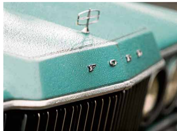
Sofisticação. Sedã tem ótimo acabamento e amplo espaço graças a soluções como alavanca de câmbio na coluna da direção e bancos inteiriços. Por causa da dianteira enorme, símbolo sobre o capô serve de ‘guia’

ACESSE AUTOLINE.COM.BR . COMPRE E VENDA SEU CARRO