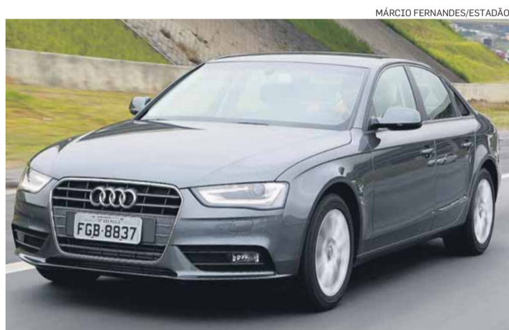
Audi. A4 2.0 baixou de R$ 129.200 para R$ 111.900 à vista

te mês terá o preço reduzido de R$ 122.950 para R$ 109.950. O Audi A3 1.4 baixou de R$ 95.900 para R$ 89.900 e o sedã A4 2.0, de R$ 129.200 para R$ 111.900.