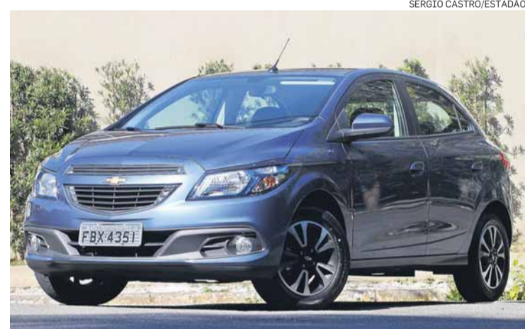
GM. Onix é destaque em feirão na fábrica de São Caetano