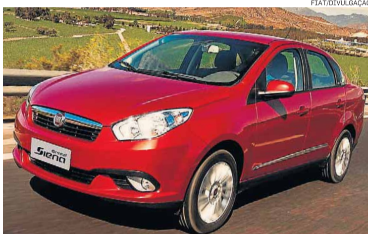
Fiat. Grand Siena 1.6 tem abatimento de quase R$ 2.800