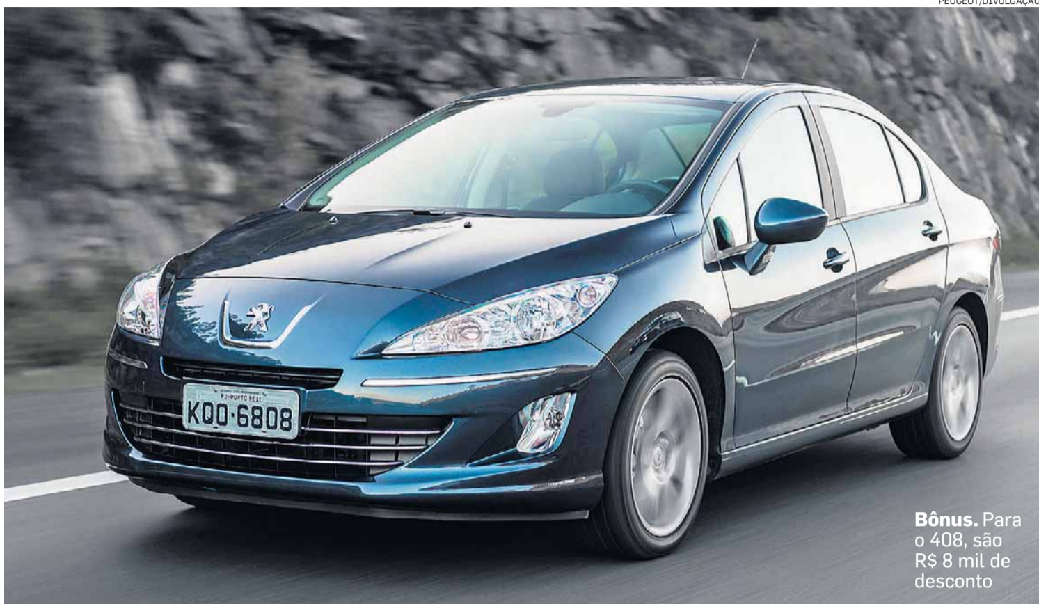
Bônus. Para o 408, são R$ 8 mil de desconto

Há condições especiais também para modelos da Fiat com ar-condicionado, direção hidráulica, vidros e travas elétricos. O Uno Vivace de quatro portas com esses itens é oferecido a R$ 30.990. O pagamento