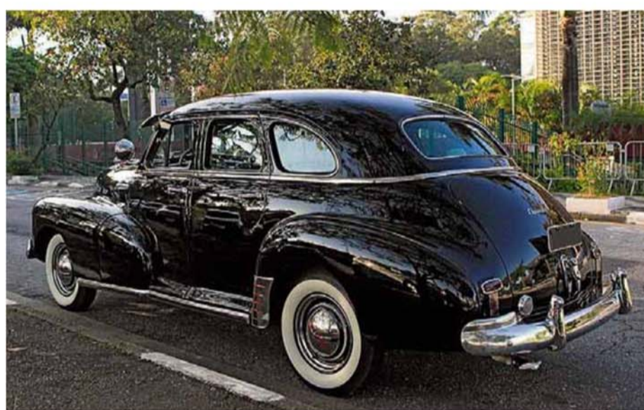
Americano. Modelo foi fabricado nos Estados Unidos de 1946 a 1948 e marcou presença no Brasil na década de 1950, até como táxi

Entre as várias histórias, há também perrengues. “Certa vez os convidados queriam amarrar latas no para-choque traseiro e escrever na carroceria com batom e giz. Minha sor-