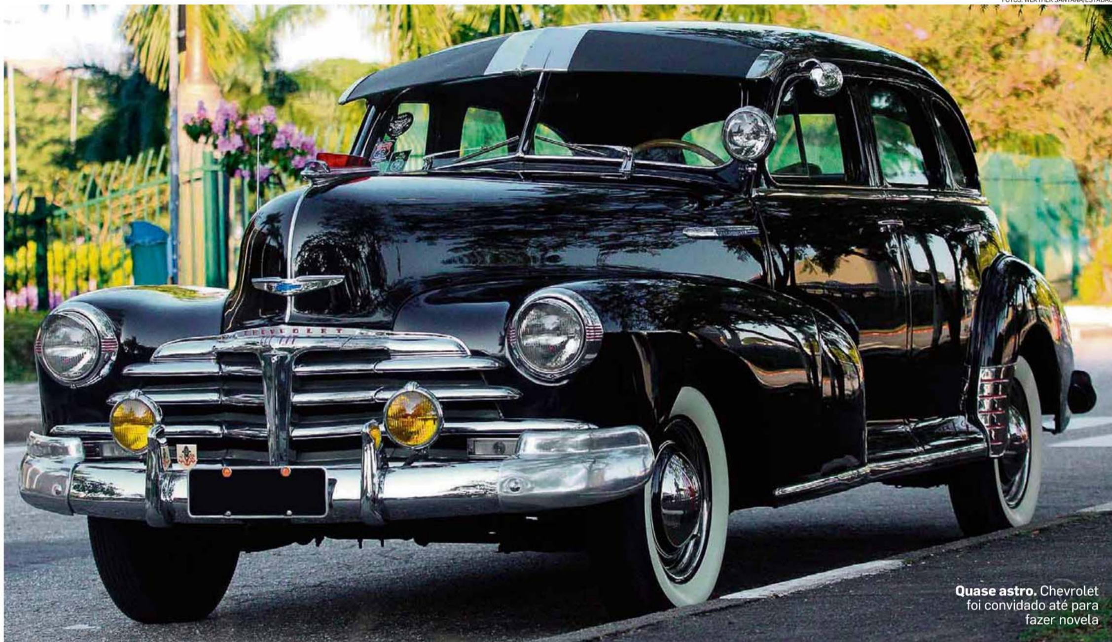
Quase astro. Chevrolet foi convidado até para fazer novela