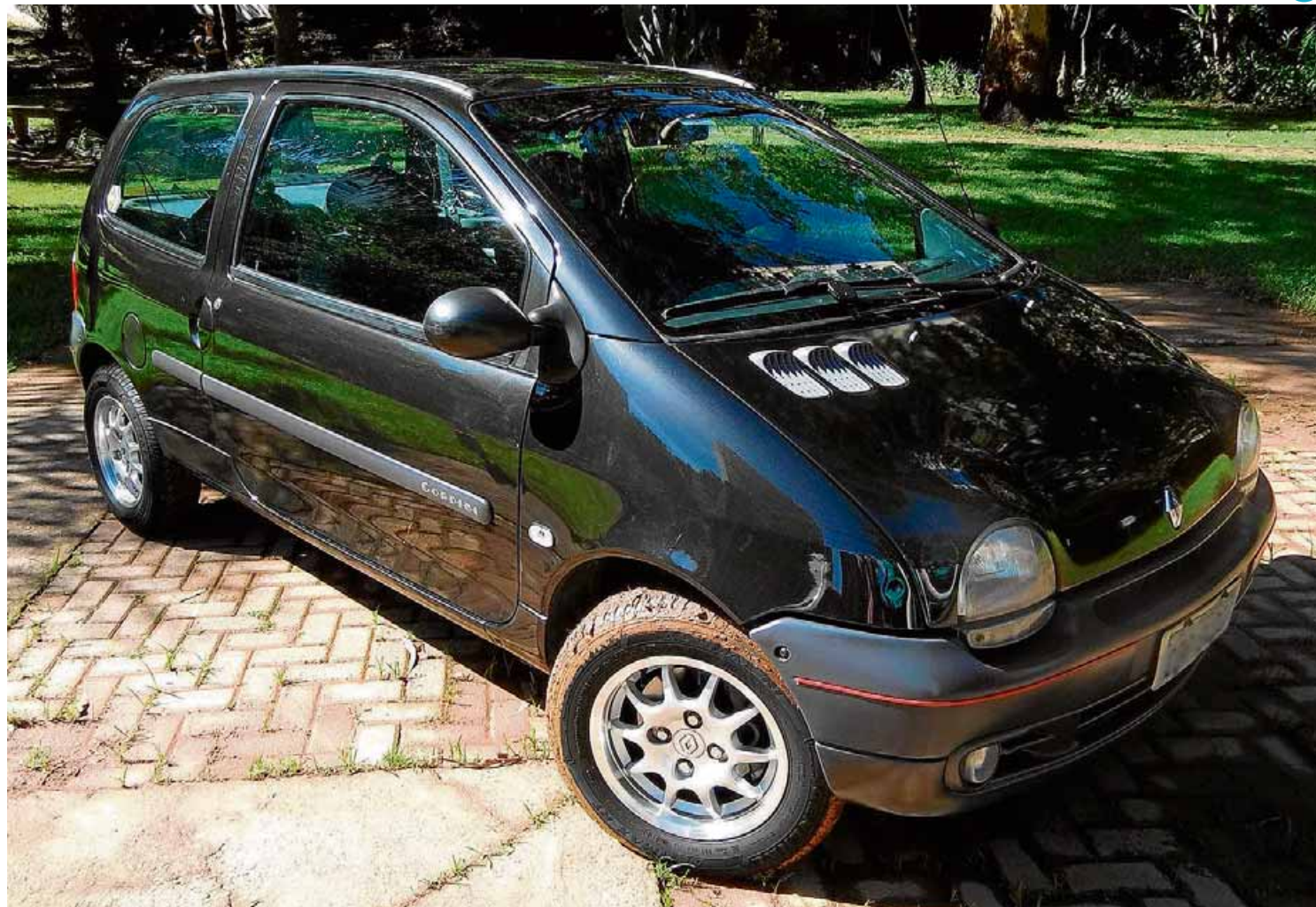
FOTOS: FELIPE RAUI/ESTADÃO - TIRADAS COM MOTO Z PLAY + HASSELBLAD TRUE ZOOM

Acessórios. O Renault recebeu rodas esportivas e instrumentos extras no painel. Fora isso, é inteiramente original